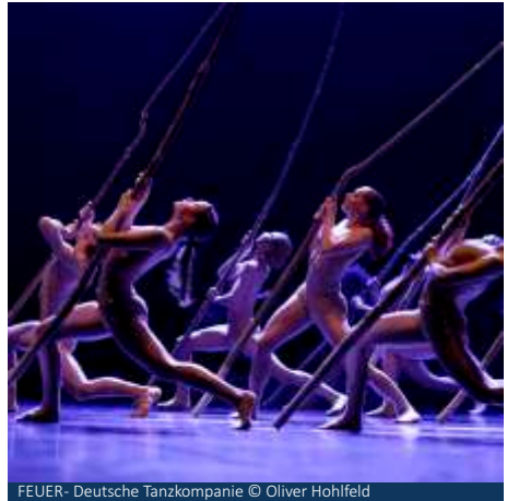
FEUER - Deutsche Tanzkompanie