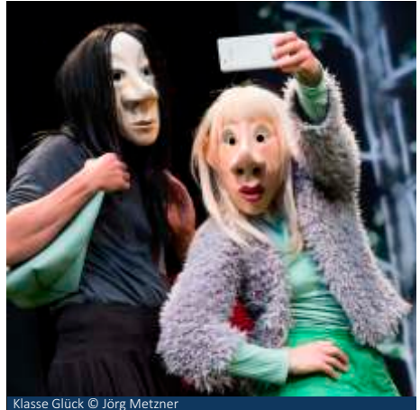
Klasse Glück