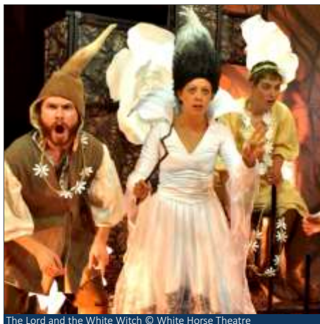
The Lord and the White Witch © White Horse Theatre